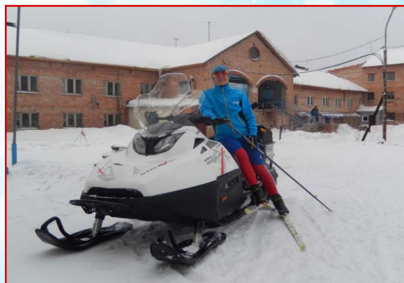
Новый снегоход «Россомаха» S-800.

Просп. Ак. Лаврентьева, 11, к. 423. Редактор И. В. Онучина. Телефон: 8 (383) 329-49-80 Эл. почта: onuchina@inp.nsk.su