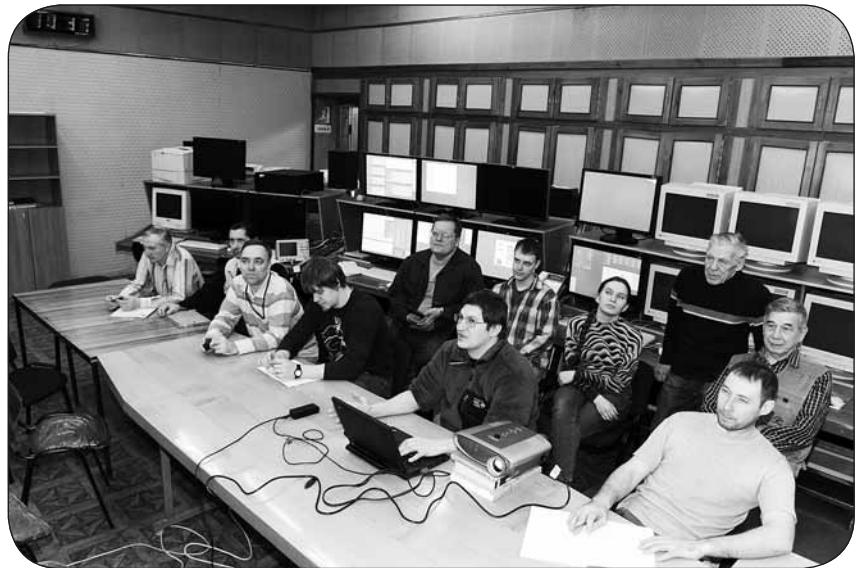
Планерка в пультовой инжекционного комплекса.

Работа над таким масштабным долгосрочным проектом сформировала в лаборатории 5-1 коллектив профессионалов высокого уровня. Серьезный вклад в общее дело вносят