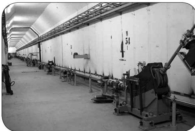
Общий вид канала на ВЭПП-3.