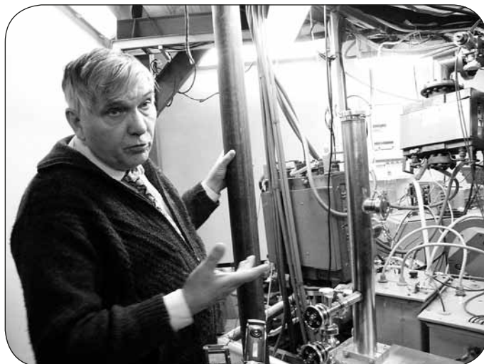
О возможностях УМС рассказывает чл.-корр. РАН В. В. Пархомчук.

стабильной работы всего комплекса от ионного источника, ускорителя, перезарядной мишени до финального детектора ионов.