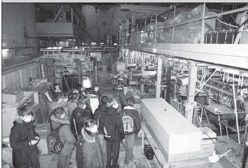
Плазменная установка — это круто!

тем не менее, наш институт посетило рекордное количество школьников: 463 старшеклассника из 19 образовательных учреждений Новосибирска и области (четыре группы перенесли на более поздний срок, но не отменили свои экскурсии).