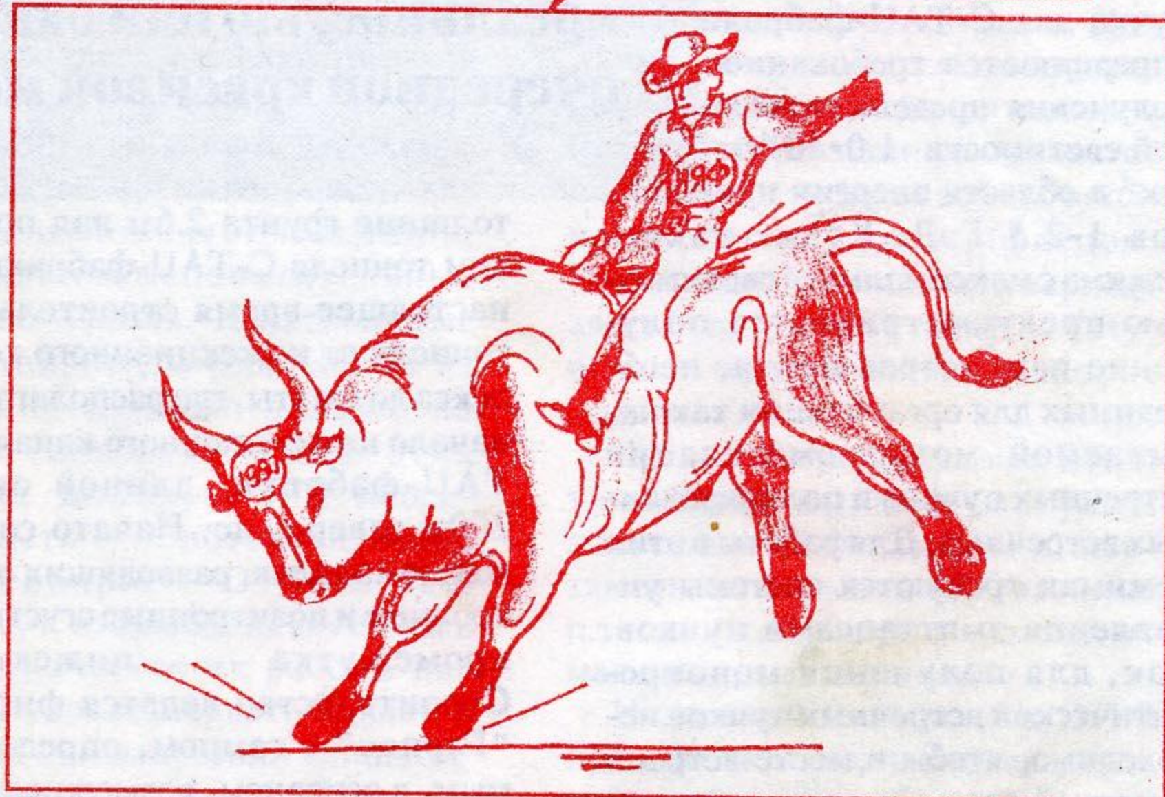
Рис. Е. Бендера

Счастья и благополучия Вам и Вашим близким!