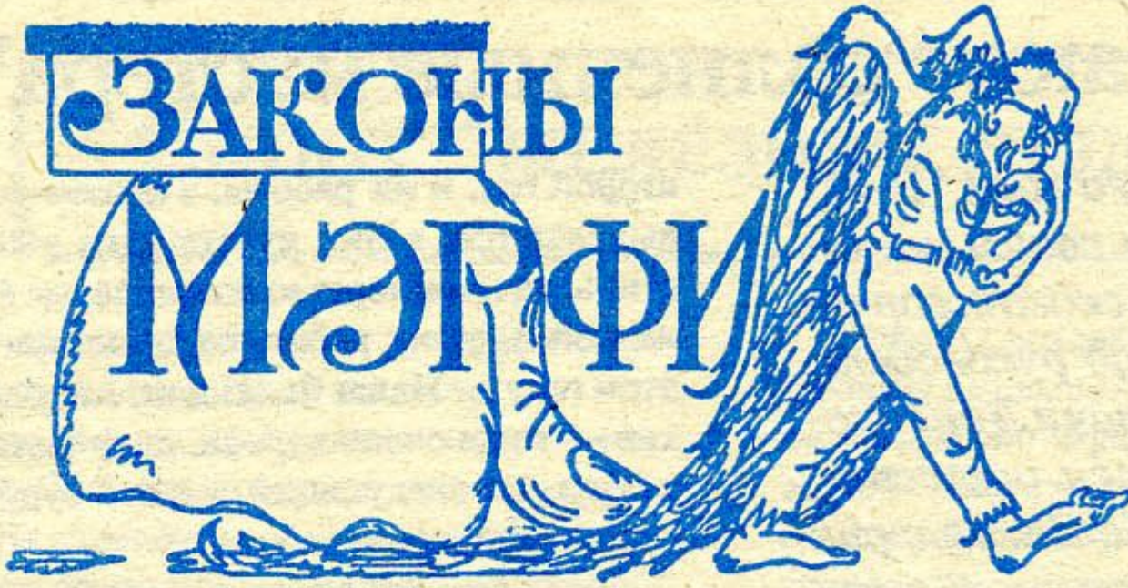
Рисунок Е. БЕНДЕРА.

(Продолжение. Начало см. №№ 8-9, 10, 12, 13 1991 г.: № 1, 3 1992 г.)